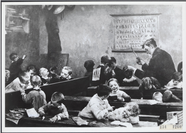
Cartoon uit de 19e eeuw over het onderwijs

enthousiast over Van Cleef. Alleen constateerde hij wel dat de man niet naar waarde geschat werd en dat er bij de ouders teveel het vooroordeel heerste tegen al wat nieuw was. Was Van Cleef te progressief? Wilde hij teveel? Negatieve berichten waren er niet en zijn school werd zo goed bezocht, dat het schoolgebouw te klein werd. Eind 1850 kon Van Cleef een nieuw gebouw feestelijk inwijden, wat afgesloten werd met een optocht van de schooljeugd door het dorp. De bouw was mede mogelijk gemaakt door een rijkssubsidie van f. 1200,=.